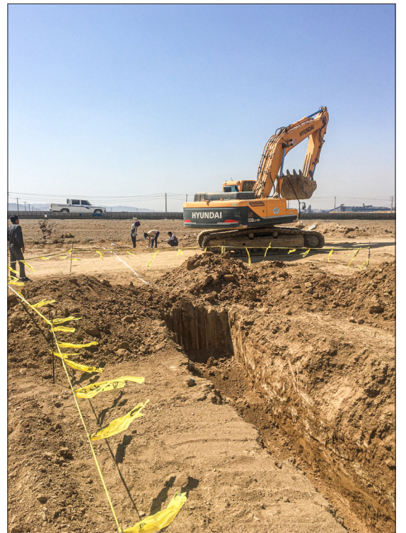
مشاور: نهاد آب