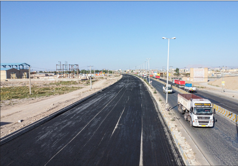
مشاور: رهنمای شرق راه