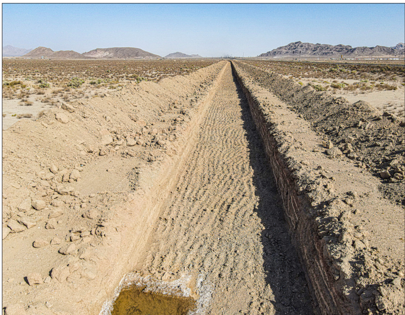
مشاور: رهنمای شرق راه