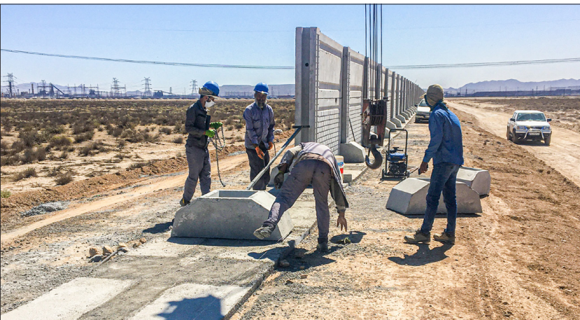
مشاور: طرح گارنو