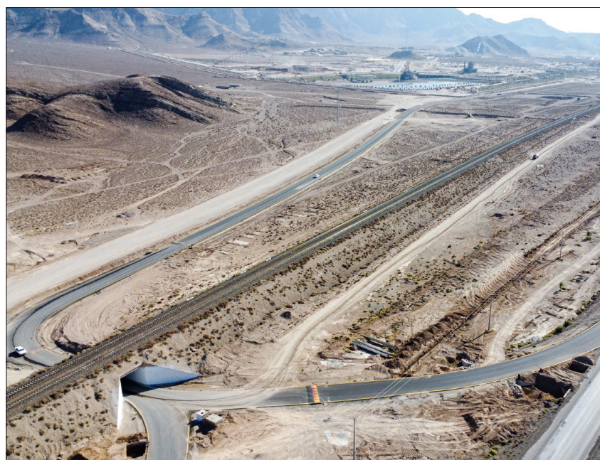
پیمانکار: شرکت پ بل