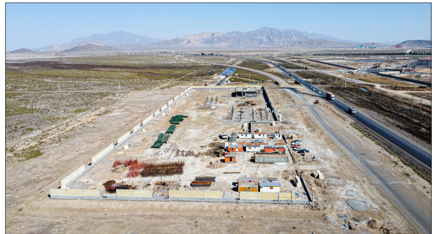
احداث سایت و ساختمان‌های پاسگاه خیرآباد - فاز ۱ اعتبار پروژه: ۳۰۰ میلیارد ریال میزان پیشرفت: ۳۶ درصد