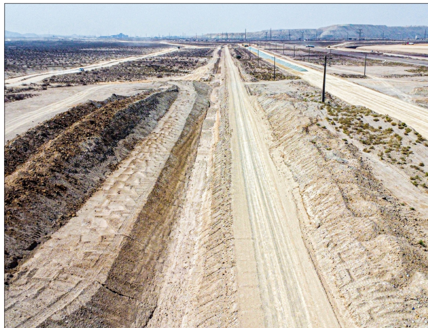
پیمانکار: شرکت بهر سیرجان