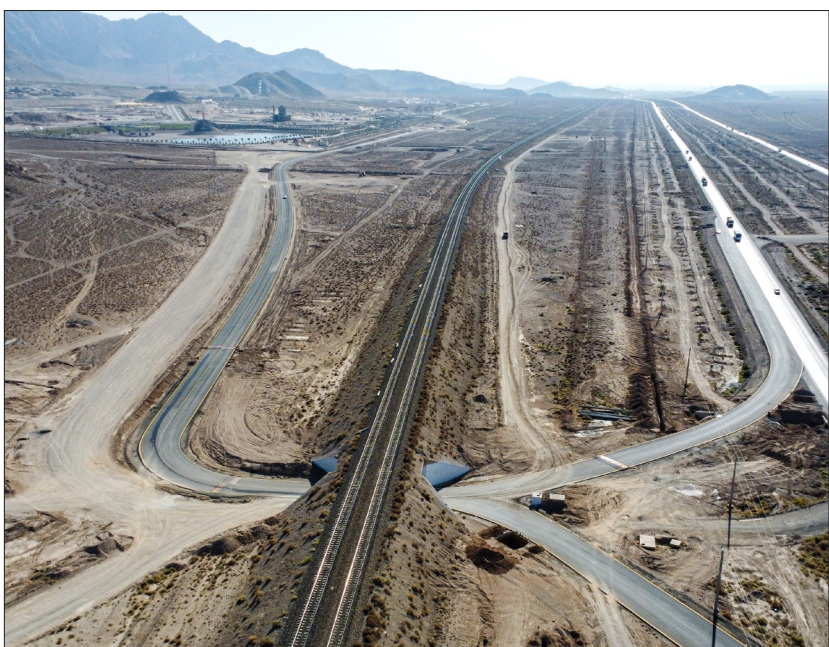
مشاور: رهنمای شرق راه