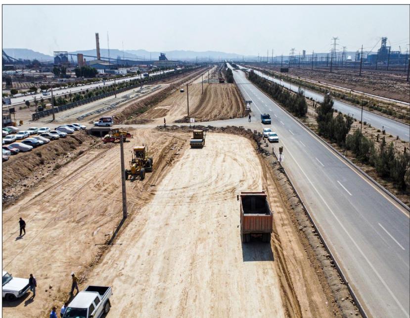
مشاور: طرح گارنو