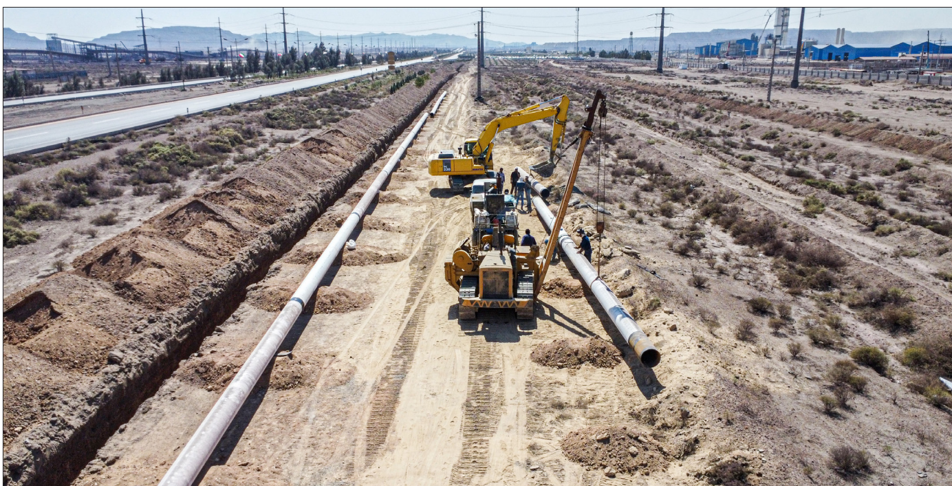
تهیه مصالح و اجرای خط انتقال گاز ۲۰ اینچ مابین ایستگاه های CGS1, CGS2 منطقه گل گهر سیرجان اعتبار پروژه: ۷۵۰ میلیارد ریال میزان پیشرفت: ۹۱,۳۵ درصد پیمانکار: شرکت تلاشگر آرتا مشاور: سیبانش نوس