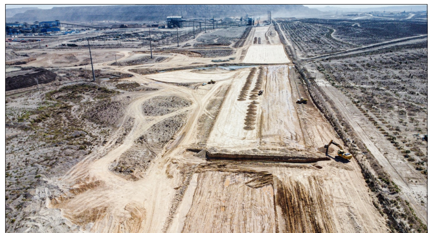
اجرای تقاطع های غیر همسطح فاز ۴ شبکه ریلی با کندرو گلفا، مسیر دسترسی استکر و جاده شماره ۳ گل گهر اعتبار پروژه: ۵۵۰ میلیارد ریال میزان پیشرفت: ۲۵ درصد