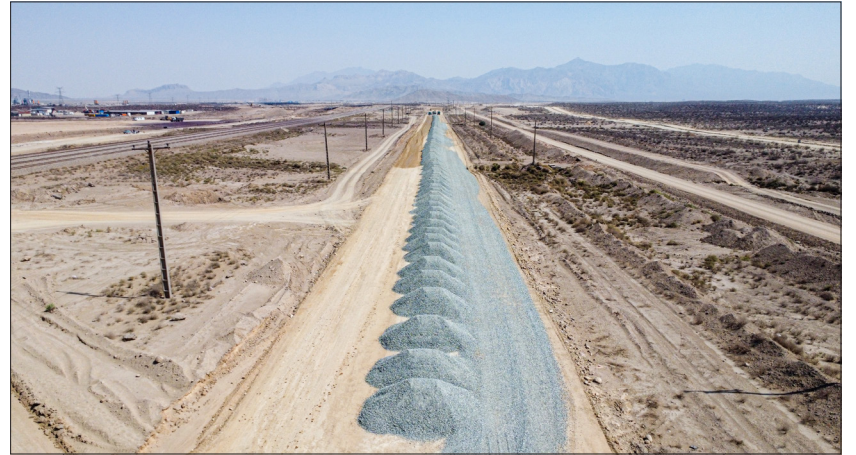
عملیات بهسازی جاده‌های شرقی منطقه گل گهر (قطعه اول چاه دراز-انبار ناربه-معدن ۴) اعتبار پروژه: ۵۰۰ میلیارد ریال میزان پیشرفت: ۶۰ درصد