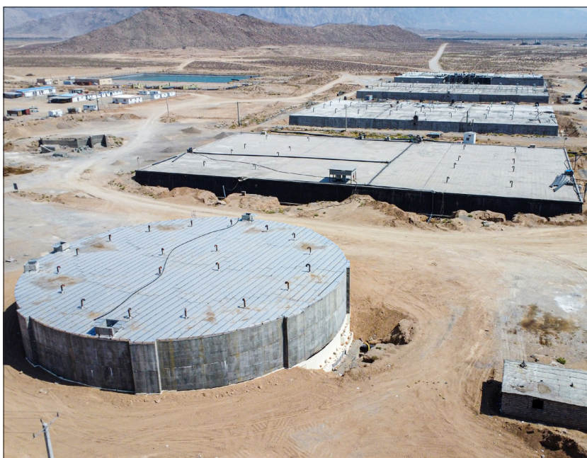
مشاور: مهندسين لار