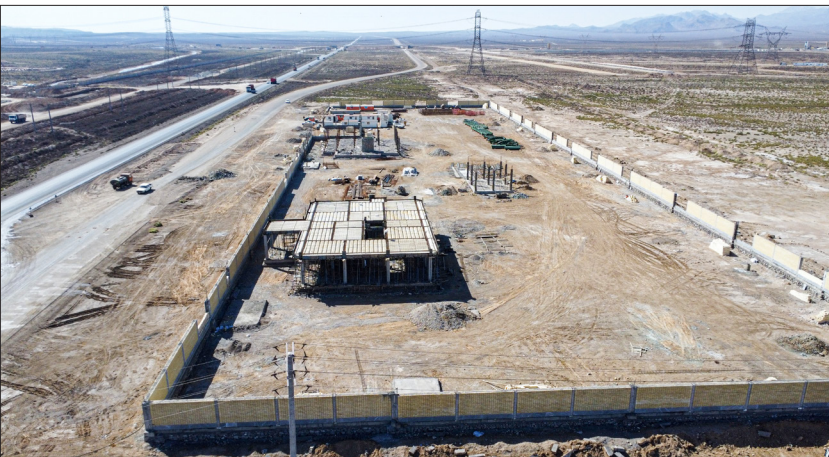
مشاور: ابنیه نواندیش