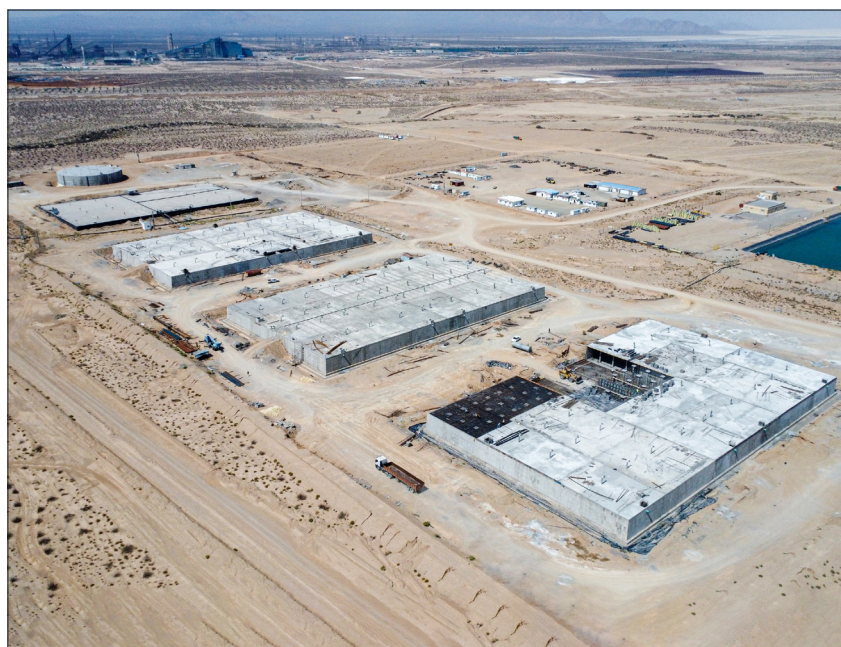
طراحی، اجرا، نصب و راه اندازی سه باب مخزن ۳۰۰۰۰ مترمکعبی در سایت آبی گل گهر میزان پیشرفت: ۸۰ درصد اعتبار پروژه: ۱۰۰۰ میلیارد ریال