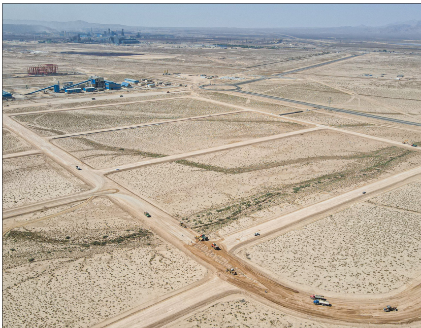
مشاور: طرح گارنو