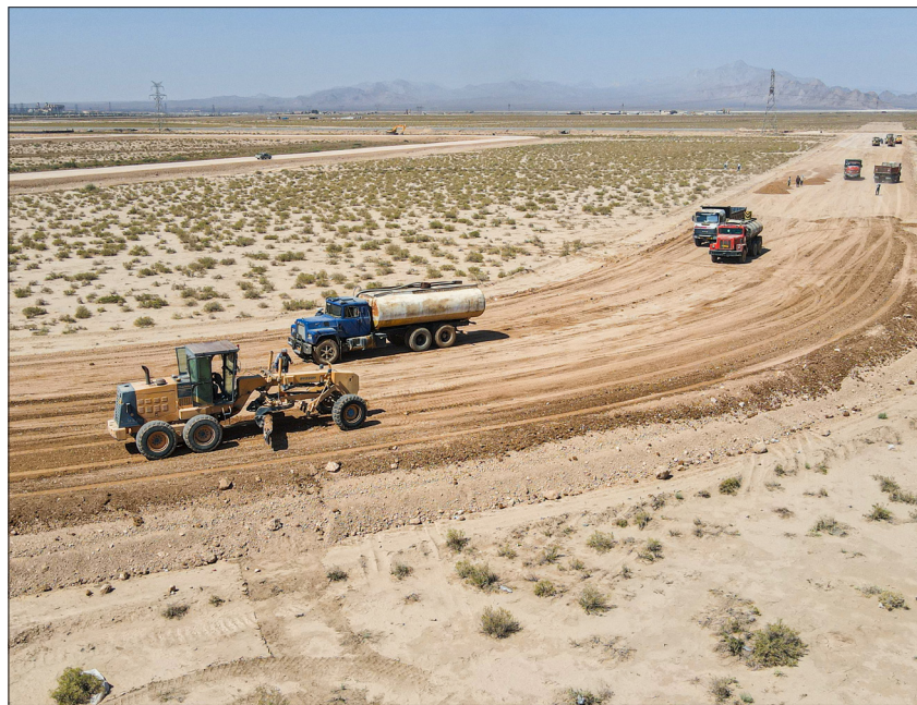
زیرسازی معابر داخلی شهرک صنعتی تخصصی منطقه گل گهر پیمانکار: شرکت ژيوار توسعه کرد اعتبار پروژه: ۸۰۰ میلیارد ریال