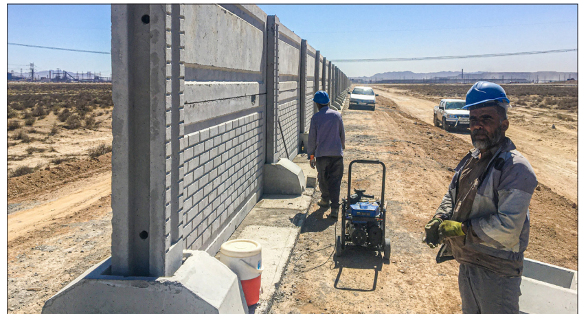
اجرای دیوار حصار شهرک حمل و نقل منطقه گل گهر اعتبار پروژه: ۴۰۰ میلیارد ریال میزان پیشرفت: ۷۵ درصد